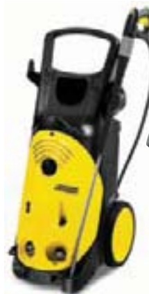
HD 10/25 Vex