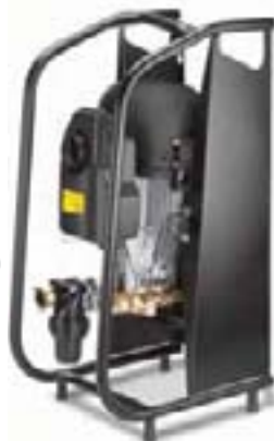
HD 7/17-4 Cage Classic